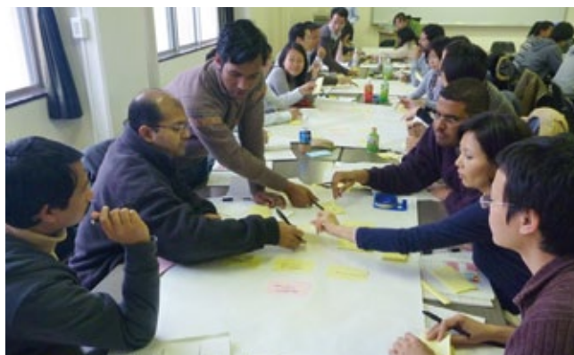
Discussion at Project Cycle Management Workshop