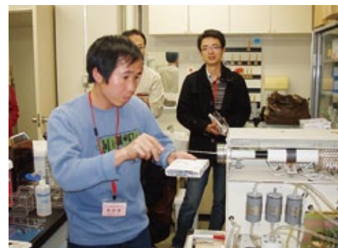
A Vietnamese student who measures the methyl mercury content in his hair

In the coming year, topics such as the history of Minamata disease, the ecosystems in the Aso area, and the groundwater flow system of Kumamoto city will be included in classroom education to make field trips more fruitful to students.