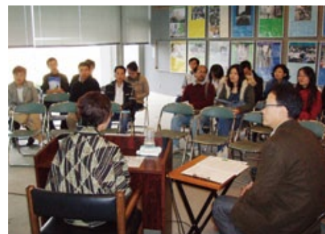
Direct dialogue between a Minamata Disease patient and EDL students

の講義の中に水俣の歴史、阿蘇の生態系、熊本の地下水資源といったトピックを入れることで、座学とインターンシップのつながりを強化する予定である。