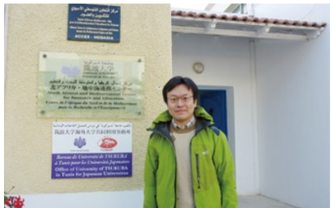
Office of North Africa and Mediterranean Center for Research and Education