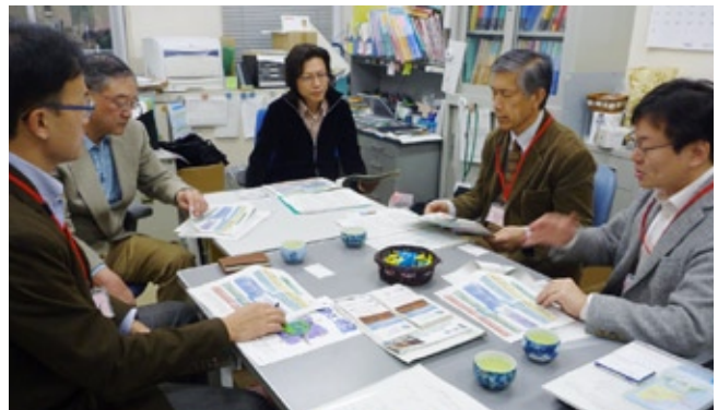
Meeting at NIMD