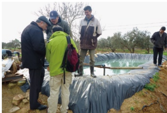
チュニス東部のボン岬半島における灌漑用貯水池の水質調査の様子

また高等教育省のケルケニ局長及びJICA事務所を訪問し、本プログラムの概要説明を行い、広報活動と優秀な受講希望学生募集について協力要請を行った。